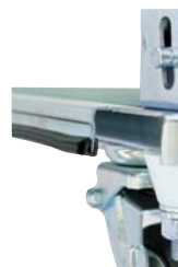
クッションゴム断面