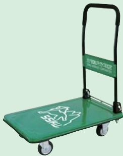
社名・ロゴマーク入り運搬台車