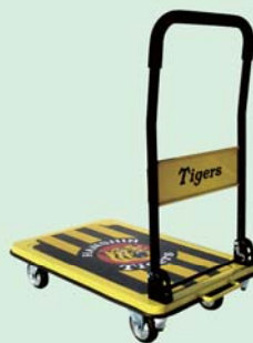
マスコットキャラクター運搬台車