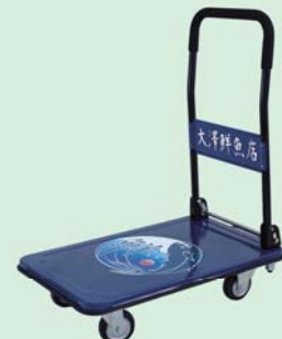
鮮魚店仕様運搬台車