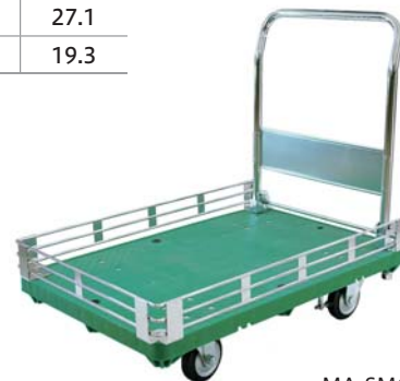
MA-SMG-3 ※ハンドル固定付もできます。