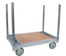
支柱(単管パイプ)付 (オプション)

※オプション:支柱(単管パイプ:外径φ48.6mm・長さ965mm) ※UWウレタン車輪キャストのみ対応可能です。 ※標準は4輪全て自在回転キャストです。固定キャストへの取替えも可能です。