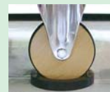
ストッパーゴム (別売り)