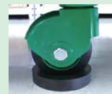
ストッパーゴム (別売り)