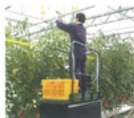
大型施設内での高所作業に活躍します。