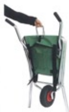
右のL/Lと 0.8kg (約2kg付)

最大許容質量 30kg ココ×クダ 460×1080mm ハンドルの高さ 740mm 自重 3.0kg タイヤ 空入式車輪: 3.00-4 (車輪径 260mm) 許容量 43L シートの素材 ナイロン100% <タイヤ> ・エアレス車輪: 3.00-4付 (車輪径 250mm) <車輪径> ・フルシートタイプ (選別型) TC-1004A-K O.B. ・交換用シートの取り違いがございます。TC-1004A-K O.B.